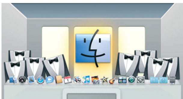
1. Platz: „The Last Supper“ von Julian Raschke

In Mac Life 11.2007 riefen wir Sie dazu auf, ein Interface-Künstler zu werden und dem Vorbild des Künstlers Johannes P. Osterhoff nachzueifern. Er nutzt die Bestandteile der Benutzeroberfläche von Mac OS X („Aqua“), um neue Gebilde in einem neuen Kontext zu schaffen und damit die Wahrnehmung zu schärfen für das, was wir täglich (über)sehen.